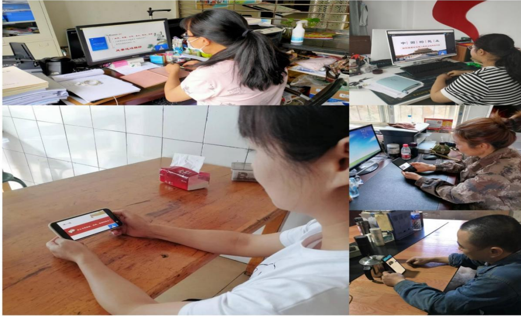
学生参加思政课网络直播教学活动