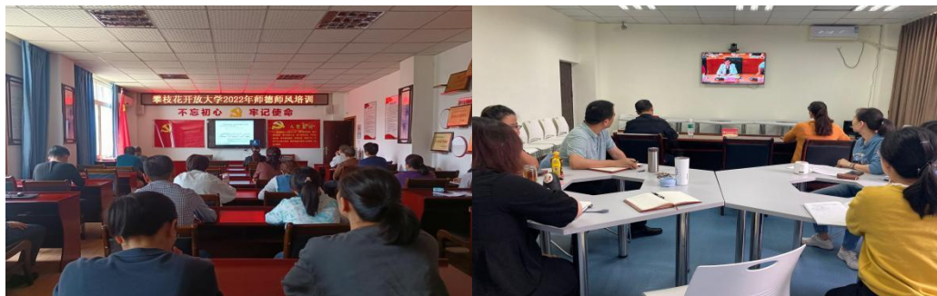
全校教师收看师德师风培训直播

4月12日下午14点，攀枝花开放大学全体教职工在教学楼二楼会议室参加国开大举行的办学组织体系教师师德师风视频直播培训。