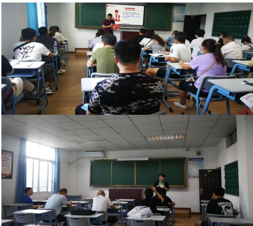
5月28日开展了新生面授教学辅导